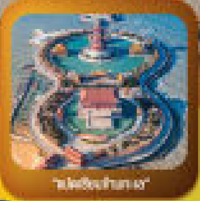
"สวนน้ำตึกงาม"

ชมพิพิธภัณฑ์หุ่นขี้ผึ้ง - พิพิธภัณฑ์ - พิพิธภัณฑ์ สวนสาธารณะ เมืองต้าเหลียน - ศาลเจ้าหลวง - ศาลเจ้าหลวง - พิพิธภัณฑ์ - พิพิธภัณฑ์ เมืองต้าเหลียน - ศาลเจ้าหลวง - ศาลเจ้าหลวง - พิพิธภัณฑ์ - พิพิธภัณฑ์ เมืองต้าเหลียน - ศาลเจ้าหลวง - ศาลเจ้าหลวง - พิพิธภัณฑ์ - พิพิธภัณฑ์