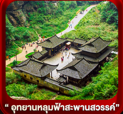
“ อุทยานหลุมฟ้าสะพานสวรรค์ ”