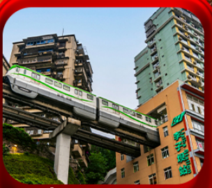
“ นิ่งรถไฟทะเล ”

บินตรงลงฉิง • อุ๋หลง หลุมฟ้าสะพานสวรรค์ • ระเบียงแกว • อุทยานเขานางฟ้า หงหยาดัง • นิ่งรถไฟทะเล • ศาลาประชาคม (ด้านนอก) • หลงหมินฮ่าว มรดกโลกผาหินแกะสลักต้าจู้ • วัดหลิวฮั่น • ตึกตะเกียบ • หมู่บ้านโบราณสี่ซีโหว่