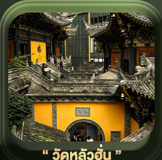
“ วัดหลัวฮั่น ”