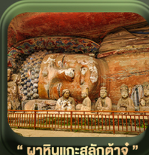
“ ผาหินแกะสลักต้าจู้ ”