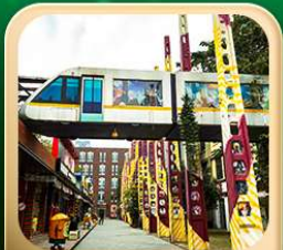
“ตงเจียวจี้”