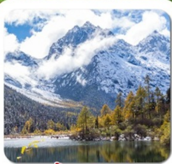
“ปี้เผิงโกว”

ชมความงาม 2 อุทยาน • สี่ดรุณี ช่องเขี้ยวโกว + ปี้เผิงโกว • พระใหญ่เล่อซาน สะพานหนานเจียว น้ำตาสีฟ้า • ห้างสรรพสินค้า จงซูเก๋อ • แพนด้ายักษ์บนอนเซลฟ์ ชอยกว้างชอยแคบ • ถนนคนเดินชุนซีลู่ • แพนด้ายักษ์ปิ่นตึก • ถนนคนเดินจินหลี่