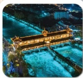
“สะพานหนานเจียว”