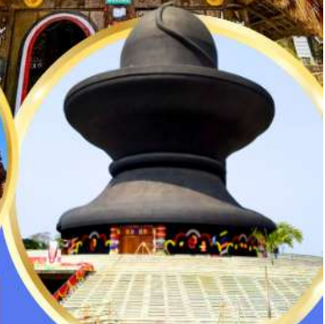
วัมมหาฤตยูชัย