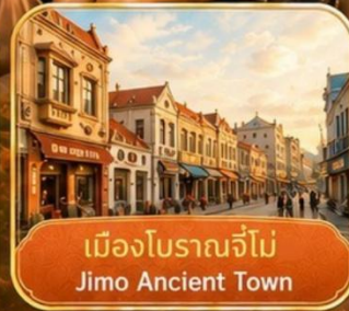
เมืองโบราณจี่โม Jimo Ancient Town