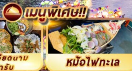
อาหารเวียดนาม ดันดาร์บ

ดานัง ฮอยอัน บานาฮิลล์ เที่ยวบานาฮิลล์เต็มวัน รวมบัตรเครื่องเล่น