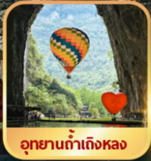
อุทยานต้าเถิงหลง