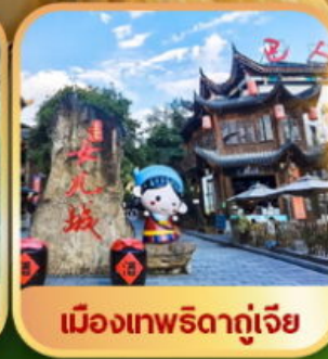
เมืองเทพริดาตุ๋เจีย