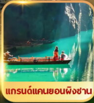
แกรนด์แคนยอนผิงชาน