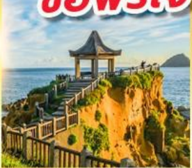
เกาะเหอผิง

พักย่านซีเหมินติง 2 คืน ขอพรเจ้าแม่กวนอิมพันมือ