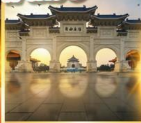
อนุสรณ์เจียงโคเชก