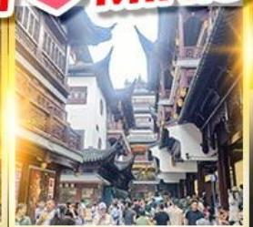
เจียงหวงเมี้ยว