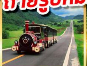
อุทยานนางฟ้า