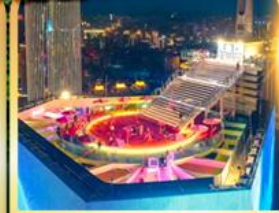
จุดชมวิวจิ่งชิ่งเวิลด์เทรด 131