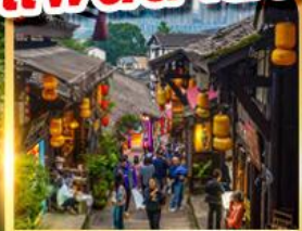
หมู่บ้านโบราณเฉิงชู่ชิว