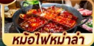
หม้อไฟหม่าล่า