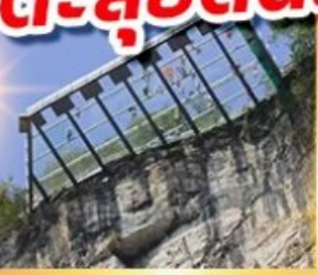
ระเบียงแก้วอุหลง