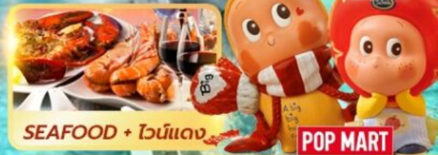
SEAFOOD + ไวน์แดง