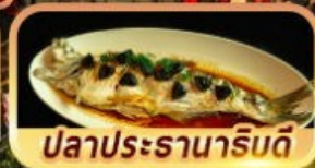
ปลาประจักษ์ริบตี