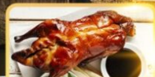
เปิด Four Season