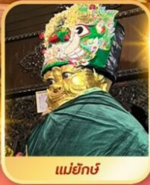
แม่ยักษ์