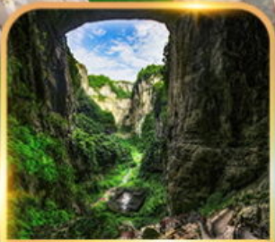
อุทยานหลุมฟ้า 3 สะพานสวรรค์