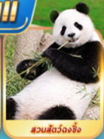
สวนสัตว์ฉงชิ่ง