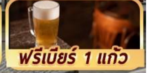
ฟรีเบียร์ 1 แก้ว