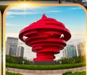
จตุรัสห้าสี