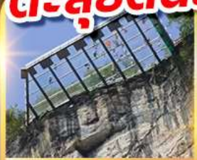
ระเบียงแก้วอุหลง