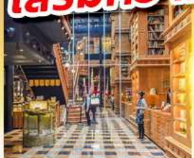
ร้านไอศกรีมมียาฮารา