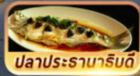
ปลาประดานาหรับดี