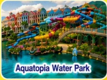
Aquatopia Water Park