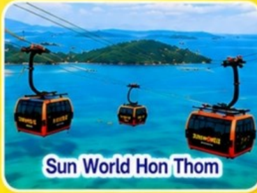
Sun World Hon Thom