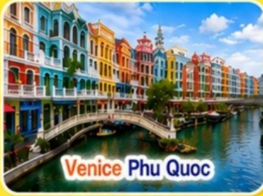
Venice Phu Quoc