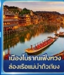
เมืองโบราณเฟิ่งหวง ล่องเรือแม่น้ำถั่วเจียง