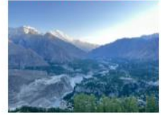
หุบเขาดยเกอร์

*พักที่ Duik : Hard Rock Resort หรือเทียบเท่า