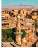
มัสยิดอัคร์