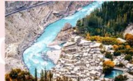
หมู่บ้าน Hopper Valley

*พักที่ Gilgit : Kellisto Hotel หรือเทียบเท่า