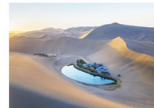
ทะเลทรายหมิงซาซาน ทะเลสาบพระจันทร์เสี้ยว

16.32 น. ออกเดินทางสู่เมืองอู๋หลู่ฟาน ด้วยรถไฟความเร็วสูง ขบวนที่ D55