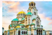
Alexander Nevsky Cathedral

15.45 น. ออกเดินทางสู่สนามบินอิสตันบูล เที่ยวบิน TK1032