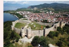
St. John at Kaneo Church บ่อมปราการซามูเอล

** พักที่ Hotel Holiday Inn 4* หรือเทียบเท่า **