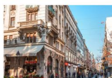
วิหารเซนต์ซาวา บ่อมปราการเมลเกรต ถนน Knez Mihailova

** พักที่ Abba Hotel 4* หรือเทียบเท่า **