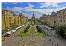
เมืองซีบีอู