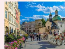
เมืองคราคูฟ

** พักที่ Golden Tulip Krakow Kazimierz Hotel 4* หรือเทียบเท่า **