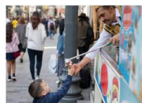
ไอศกรีม Maraş ชมพระอาทิตย์ตกดิน ณ ภูเขาเนมรุต