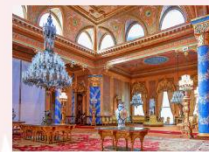
Beylerbeyi Palace ล่องเรือช่องแคบบอสฟอรัส