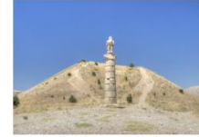
สุสานคาราคูช