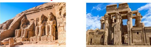
มหาวิหารอาบูซิมเบล วิหารคอมอมโบ

** พักที่ Jaz Crown Prince Cruise 5* หรือเทียบเท่า **