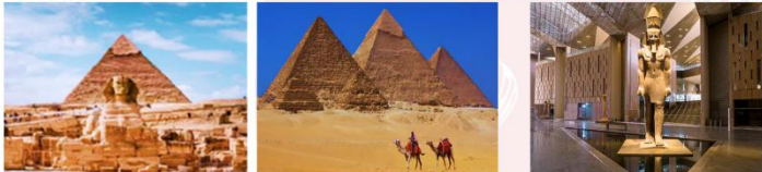
มหาพีระมิดกิซา Grand Egyptian Museum

** พักที่ Mamlouk Pyramids Hotel 4* หรือเทียบเท่า **