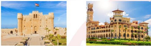
ป้อมปราการซีตาเดล พระราชวังอัลมอนด์อาซาร์

** พักที่ Mamlouk Pyramids Hotel 4* หรือเทียบเท่า **