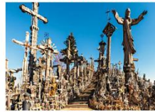
Hill of Crosses