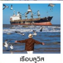
เรือลิวอิส