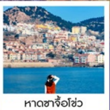
หาดซาจื่อฮั่ว