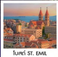
โบสถ์ ST. EMIL