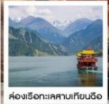
เป็นรายหมื่นชาซาน