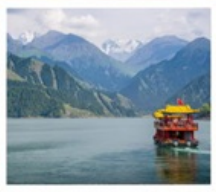
ห้องเรือทะเลสาบเทียนฉือ

เส้นทางสายไหม เริ่มต้นเพียง 53,999 FREE VISA