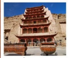
ถ้ำม้อเถา