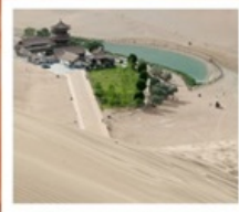
เป็นทรายหมิงซาซาน