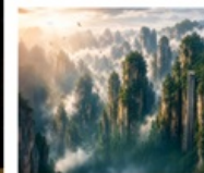
เซาอวตาร