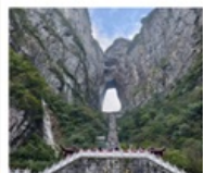
เขากิ๊นเหมินซาน