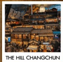
THE HILL CHANGCHUN