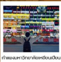
กำแพงมหาวิทยาลัยเหยียนเปียน