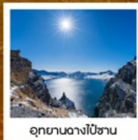
อุทยานอางโป๋ซาน