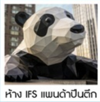
ห้าง IFS แพนด้าป็นตึก