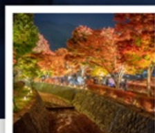
อุโมงค์เมบิล