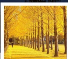
สวนเอ็กซ์โป