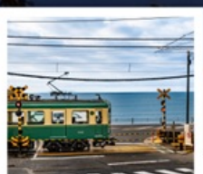
รถไฟเอโนะเดิน