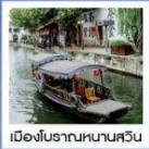
3 ตึกใหญ่แห่งเมืองเซี่ยงไฮ้ | เซี่ยงไฮ้ คลาสสิก ไทท์ | เมืองโบราณหนานสวิน