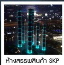
ห้างสรรพสินค้า SKP