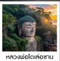
หลวงพ่อโตเล่อซาน