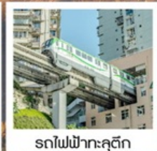
รถไฟฟ้าทะลุคึก