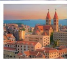
โบสถ์ ST. EMIL