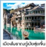
เมืองโบราณกู่เป่ย์ซู่ยี่จิน