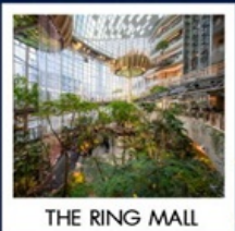
THE RING MALL