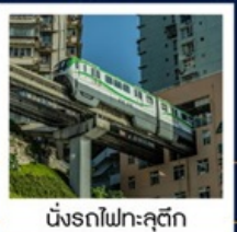
นั่งรถไฟทะลุติ๊ก