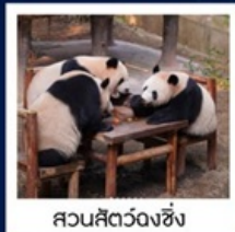
สวนสัตว์ฉงชิ่ง

สวนสัตว์ฉงชิ่ง • เมืองโบราณซือปาเก้ • หมู่บ้านโบราณฉือซีชี่ว • มหาศาลาประชาคม นั่งรถไฟทะลุติ๊ก • ถนนโบราณหลงเหมินเฮ่า • ถนนเซี่ยเฮ่าหลี่ • วัดหลิวอัน • Raffles City • หงหยาดัง ถนนคนเดินเจี่ยฟ่างเป็ย POP MART • ล่องเรือแม่น้ำแยงซีเกียง • พิพิธภัณฑ์ศิลปะฉงชิ่ง • ตึกชวยซิง 22 ชั้น • THE RING MALL