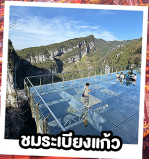
ชมระเบียงแก้ว