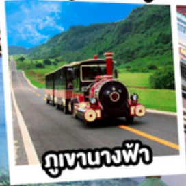
ภูเขาทางฟ้า