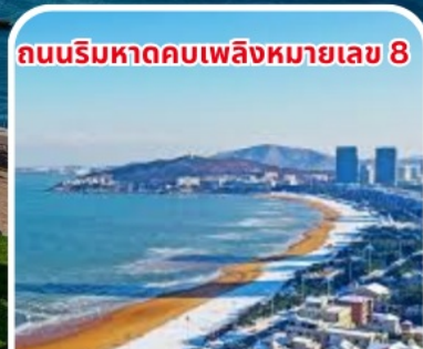
ถนนริมหาดคอบเพลิงหมายเลข 8