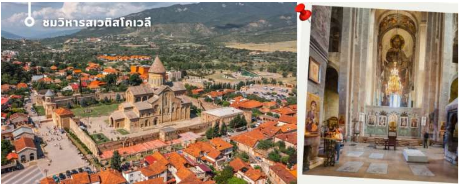
ชมวิหารสเวตส์โคเวลี

นำท่านออกเดินทางชม วิหารสเวตส์โคเวลี (Svetitskhoveli Cathedral) โบสถ์เก่าแก่ที่ถือเป็นศูนย์กลางทางศาสนาอันศักดิ์สิทธิ์ที่สุดของจอร์เจีย มีขนาดใหญ่เป็นอันดับสองของประเทศ และเป็นศูนย์รวมจิตใจของชาวคริสต์ออร์ทอดอกซ์สร้างขึ้นในราวศตวรรษที่ 11 ตัวโบสถ์มีสถาปัตยกรรมที่งดงามตามแบบฉบับของจอร์เจีย โดมสูงเด่นตระหง่าน บ่งบอกถึงความยิ่งใหญ่และศักดิ์สิทธิ์ ภายในวิหารประดับประดาด้วยภาพเขียนฝาผนังที่งดงามเล่าเรื่องราวทางศาสนา และยังมีหอคอยสูงที่สามารถมองเห็นวิวเมืองมิชเคต้าได้อย่างสวยงาม