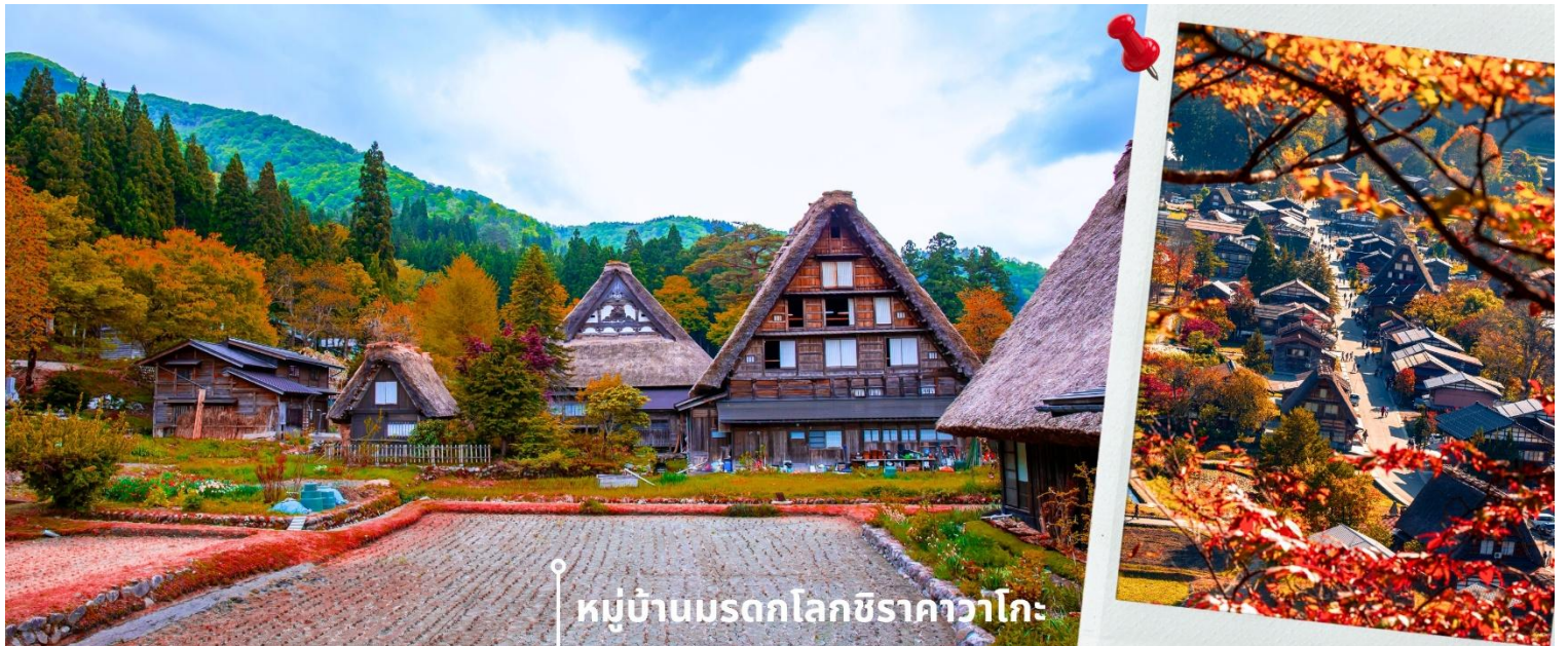
หมู่บ้านมรดกโลกชิราคาวาโกะ

จากนั้นนำท่านเดินทางสู่ เมืองกิฟุ พาท่านเข้าชม หมู่บ้านมรดกโลกชิราคาวาโกะ หมู่บ้านแห่งนี้ ตั้งอยู่ในหุบเขาสูงห่างไกลความเจริญ ทำให้ยังรักษาขนบธรรมเนียม ประเพณีอันดั้งเดิมไว้ได้อย่างสมบูรณ์ และเป็นหมู่บ้านที่มีรูปร่างแปลกตาติดอันดับ ซึ่งได้ชื่อว่าเป็น The most beautiful village in Japan โดยมีบ้านทรงแบบ “ กัสโซ ” ซึ่งเป็นบ้านชาวนาโบราณที่มีอายุมากกว่า 250 ปี คำว่า กัสโซ มีความหมายว่า พนมมือ ซึ่งคล้ายกับรูปแบบของบ้านที่มีหลังคามุงด้วยฟางข้าวที่ทำมุมชันถึง 60 องศา รวากับสองมือที่ประนมเข้าหากัน ตัวบ้านมีความยาวประมาณ 18 เมตร กว้าง 10 เมตร ทั้งหลังถูกสร้างขึ้นโดยไม่ใช้ตะปู ภายหลังในปี 1995 ได้รับการตั้งขึ้นเป็นมรดกโลก