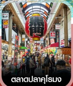
ตลาดปลาคุโรมง