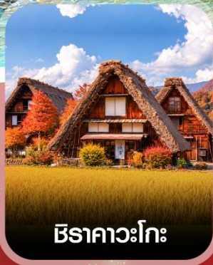
ชิราคาวะโกะ