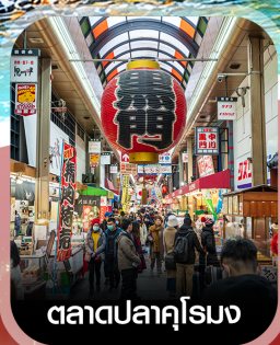
ตลาดปลาคุโรมง

✈️ คอนเฟิร์ม ออกเดินทาง ทุกพีเรียด 2 ท่านขึ้นไป