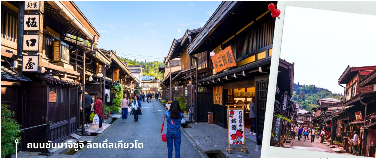
ถนนซันมาจิซุจิ ลิตเติ้ลเกียวโต

จากนั้นให้เวลาท่านเดินเล่นสัมผัสบรรยากาศกันต่อที่ ถนนซันมาจิซุจิ ซึ่งถูกขนานนามว่าเป็น “ ลิตเติ้ลเกียวโต ” บ้านไม้โบราณโทนสีน้ำตาลดำ เรียงรายไปตามทางเดิน มีคูน้ำอยู่รอบเมือง ปัจจุบันได้มีการปรับเปลี่ยนเป็นร้านค้า ร้านอาหาร ของที่ระลึก สำหรับนักท่องเที่ยวให้ได้เลือกชมทั้ง ผ้าแฮนด์เมด ชุดยูกาตะ ตุ๊กตาซารุโอะโอะ