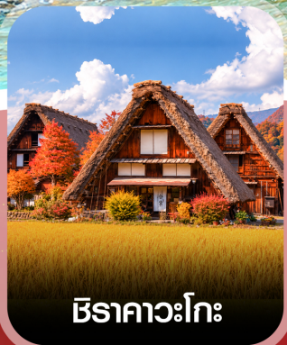
ชิราคาวะโกะ