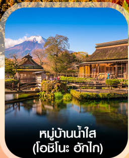
หมู่บ้านน้ำใส (โอบิโนะ อักโก)