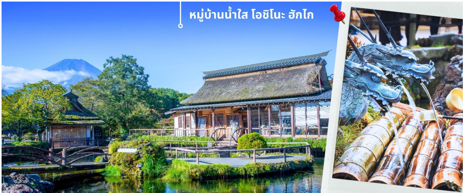
หมู่บ้านน้ำใส โอชิโนะ ะกโก

ได้รับคัดเลือกให้เป็นหนึ่งในภูมิทัศน์ทางน้ำที่งดงามในปี.ศ. 1985 อีกด้วย ทั้งยังเป็นอีกหนึ่งสถานที่ที่เราสามารถมองเห็นวิวฟูจิ หากวันนั้นเป็นวันที่ฟ้าเปิด