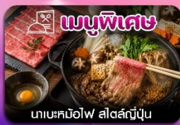
เมนูพิเศษ ทะเลหมีโอไฟ สัตว์ญี่ปุ่น

SCAN ME ซัปโปโร-อาซาฮิกาว่า-ลานสกีชิโกะ-คลองโอตารุ-โรงงานช็อกโกแลต-หมู่บ้านเทพนิยาย-ช้อปปิ้งทานุกิโคจิ-อีสระเต็มวัน